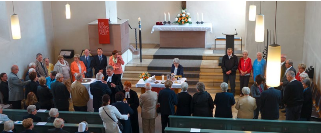
Das Abendmahl um den Tischaltar bei der Jubelkonfirmation am 24. Juni diesen Jahres.

Die Christuskirche ist eine Gabe der Generationen vor uns als Ort der Einkehr und des Gottesdienstes. Sie stellt so die Aufgabe an uns, dass wir sie auch erhalten für kommende Generationen.