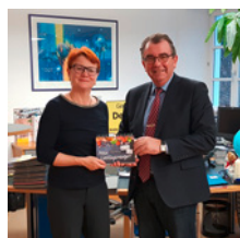
Alois Scherer, Bürgermeister von Deining, empfiehlt „Spekulatius-Tiramisu mit Himbeeren“.

Das Kochbuchteam arbeitet derzeit daran, das Buch über die Stadt- und Landkreisgrenzen hinaus anbieten zu können. Der Kauf ist demnächst online über die Internetseite der Kirchengemeinde möglich oder nach wie vor im Pfarramt.