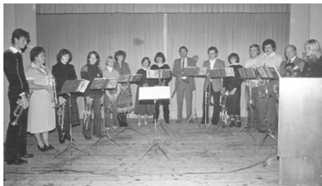
Die damalige Besetzung des Posaunenchores bei einer Probe im Januar 1980.

In Neumarkt dürfen wir dieses Jahr auf die 90-jährige Geschichte des Evangelischen Posaunenchores zurückblicken und uns auf die Jubiläumsfeierlichkeiten am letzten Wochenende im März freuen. Feiern möchten wir mit möglichst vielen Menschen aus Stadt und Land, mit Freunden, Ehemaligen und Angehörigen, mit Mitgliedern benachbarter Posaunenchor, aber auch mit der ganzen Kirchengemeinde und allen Interessierten.