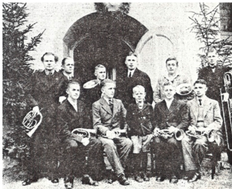
Eine Aufnahme aus dem Neumarkter Tagblatt, die aus den Anfangsjahren des Posaunenchores stammt.

Ja! Trompeten sollten sich nach Empfehlung von Michael Praetorius (Komponist, Organist und Hofkapellmeister im 17. Jh.) beim Zusammenwirken mit der Kantorei wegen ihrer Lautstärke außerhalb der Kirche aufstellen. Die Kompositionen waren seit der Renaissance im Wesentlichen nur für Posaunen geschrieben. Aber heute wollen wir – getreu dem Motto des Evangelischen Posaundienstes in Deutschland „Ich singe dir mit Herz und Mundstück“ – mit unserer Musik die biblische Botschaft von Jesus Christus nicht allzu leise verkünden.