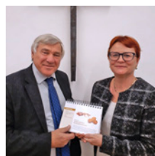
Alois Karl, MdB, mag's gern süß in Form von „Schokoschnitten“.

Das Kochbuchteam arbeitet derzeit daran, das Buch über die Stadt- und Landkreisgrenzen hinaus anbieten zu können. Der Kauf ist demnächst online über die Internetseite der Kirchengemeinde möglich oder nach wie vor im Pfarramt.